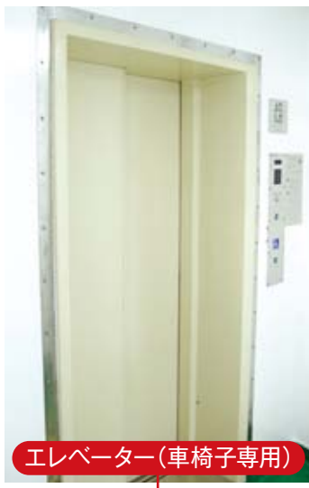
エレベーター(車椅子専用)