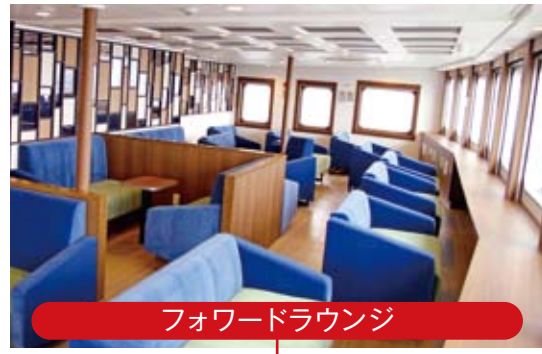
フォワードラウンジ